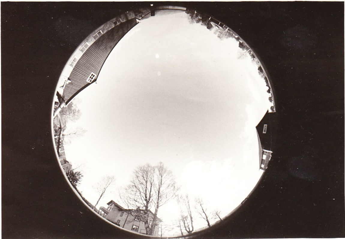
Panoramabild som visar hur omgivningen såg ut den 5 oktober 1990 inifrån Maria och Brunos nederbördsätare.