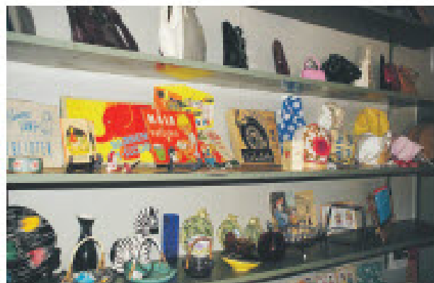
Väskor, bammöror, bäcker och mycket annat presenterades i mängd.

En mycket uppskattad föreläsning vilket märktes