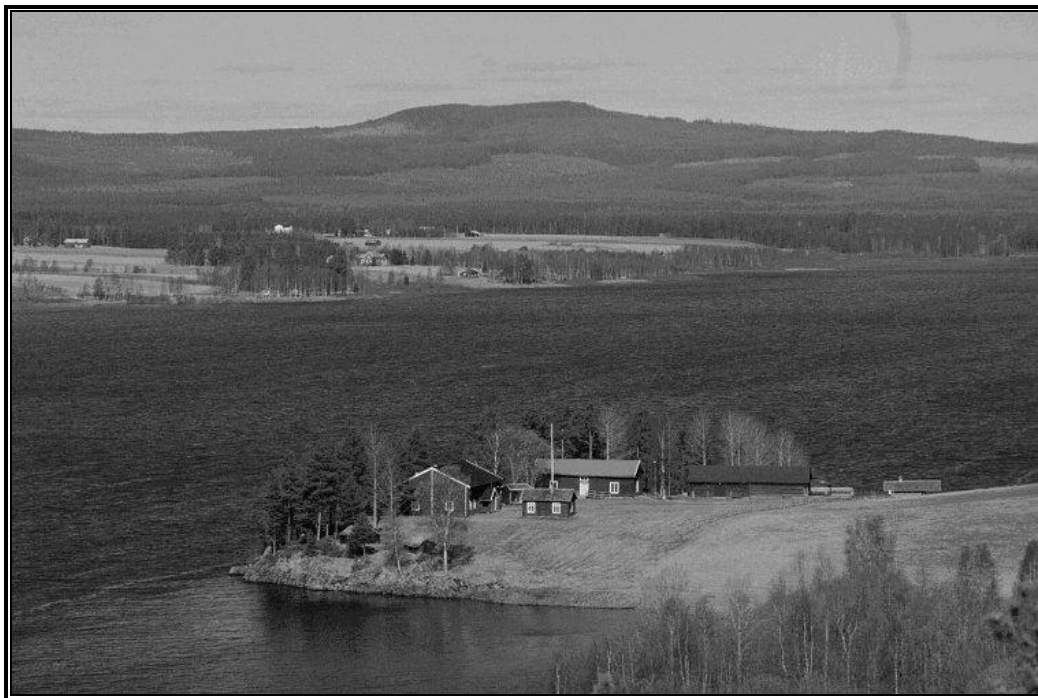
Blick vom Westufer des Örträsk-Sees