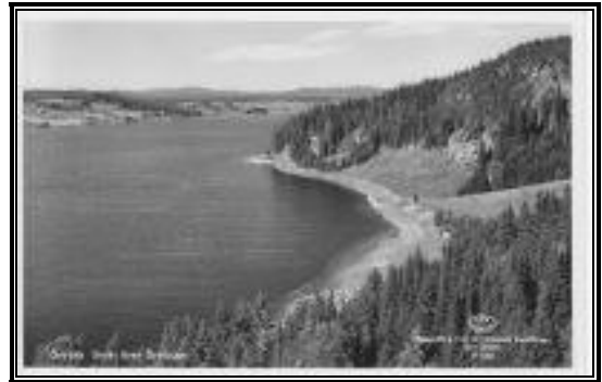
Blick über den See auf Örträsk (1960)

(Verkleinerte Ansichtskarten)