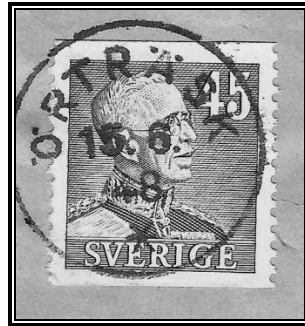
Normalstempel 59b – Örträsk, 15. 6. 48