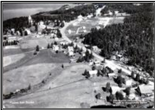
Flugaufnahme von Örträsk (1967)

Wer heute dem gut ausgebauten und landschaftlich reizvollen „Blå vägen“ von Umeå nach Mo i Rana in Norwegen folgt, der könnte bei Tegslund auf einer einsamen Landstraße einen lohnenden Abstecher nach Örträsk machen.