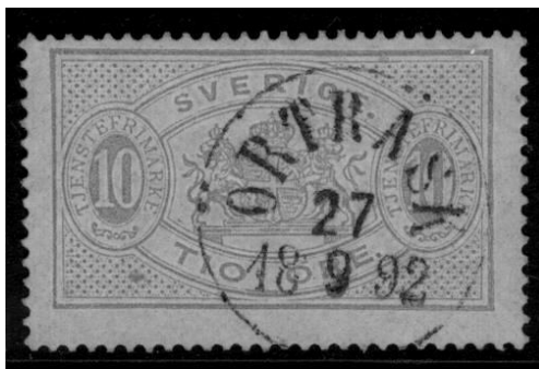
Normalstempel 10 auf einer Dienstmarke aus der Anfangszeit – Örträsk, 27. 9. 1892

In Örträsk gab es schon ab dem 1. Mai 1861 eine Vorstufe zu einer Art Postversorgung. Es wurde ein eigener „Postaufseherplatz“ (= postuppsyningsmanplats) eingerichtet. Das wurde überall dort auf dem Lande veranlasst, wo die dünne Besiedlung nur ein geringfügiges Postaufkommen erwarten ließ, insbesondere im Norrland. Diese wurden aber schon am 1. Oktober 1865 zu kleinen Poststationen umgewandelt, und somit erhielten auch die Örträsk-Bewohner eine feste örtliche Versorgung. Zu diesem Zeitpunkt gab es im ganzen Land 377 Postanstalten, davon waren 122 Postämter (= postkontor), 79 Postexpeditionen und 176 Stationen.