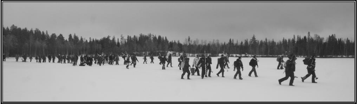
Aufbruch zum Wettbewerb um den größten Fang

Wer heute dem gut ausgebauten und landschaftlich reizvollen „Blå vägen“ von Umeå nach Mo i Rana in Norwegen folgt, der könnte bei Tegslund auf einer einsamen Landstraße einen lohnenden Abstecher nach Örträsk machen.