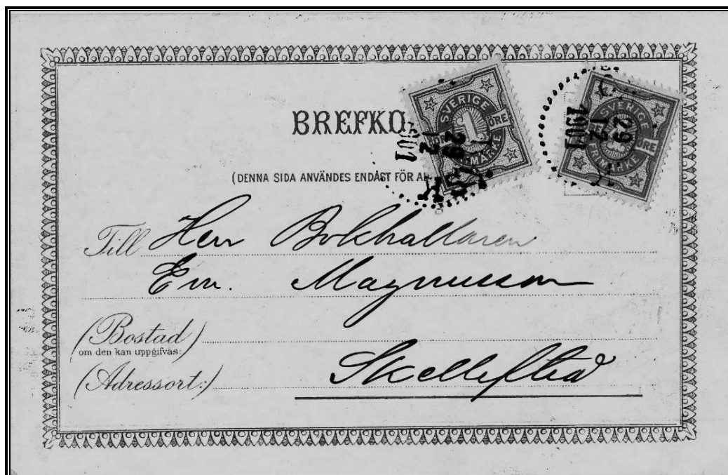
Postkarte mit Normalstempel 29 – Örträsk, 29. 12. 1901

Wo sich das Postlokal anfangs befand, ist mir nicht bekannt. Jedenfalls musste die Post für den Ort aus Bjurholm - ca. 25 km südlich gelegen - heran geschafft werden. Als die Warenbestellungen bei Postversandfirmen um 1900 zunahm und damit auch das Postaufkommen, setzte man Pferdefuhrwerke dafür ein. In den abgelegenen Landesteilen wurde ja bald alles bei Firmen wie Åhlén & Holm oder Älvsnereds Postversandhaus bestellt, von Textilien über Porzellan bis zur Jagdausrüstung.